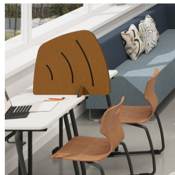
Als Sichtschutz auf Schultischen

Unser Material- und Farbsortiment finden Sie in der ASS Materialübersicht.