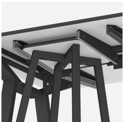
Halterung für FLEXLAB Hocker und Tidy Boxen