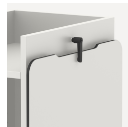
Verriegelung für Aufsatzplatte