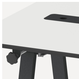
Multifunktional durch verschiedene Ausstattungsmöglichkeiten