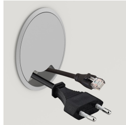
Optional mit seitlichem Kabeldurchlass