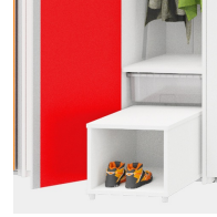
Herausziehbarer Hocker, der rutschfesten Stand bietet.