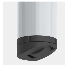
Optional Gestell fahrbar mittels 2 Rollen