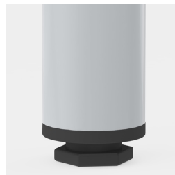
Bodenschoner mit Niveauegleich: gleicht Bodennebenheiten aus