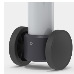
Optional Gestell fahrbar mittels 2 Bockrollen