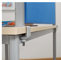
Montage mittels Inbusschraube an der Tischplatte