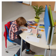
Ideal als Blick- und Schallschutz