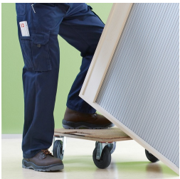
Korpus ab Werk fest verdübelt und verleimt für schnellen Aufbau vor Ort