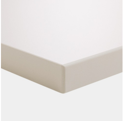
Plattenmaterial melaminharzbeschichtet mit robuster Kunststoffkante