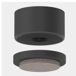
Optional Filz-Bodenschoner mit Wechseleinsatz