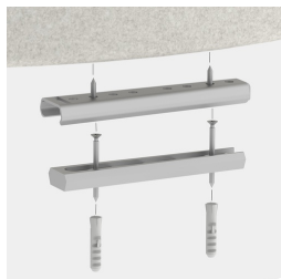
Optional mit geschraubter oder geklebter Bodenbefestigung