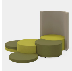
Vielfältige Kombinationsmöglichkeiten der COCOON und JOYN Serien