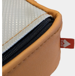
Reißverschluss mit verdecktem Zipper