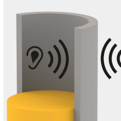
Schallschutz durch schallabsorbierenden Schaumstoff in Rückwand