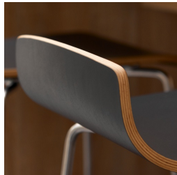
Robuste Buche-Multiplexschale mit kratzfester CPL-Beschichtung