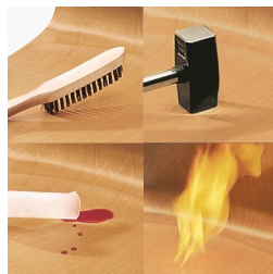
Unverwüestliche PAGHOLZ®-Schale, kratz-, bruch-, stoßfest und hitzebeständig