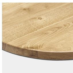
Optional mit Eiche-Massivholz Tischplatte