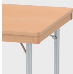
Optional mit zurückgesetzter Massivholzzarge