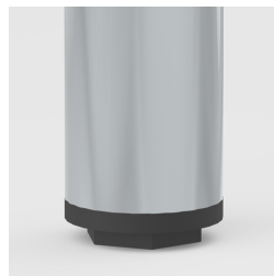
Bodenschoner mit Niveauegleich: gleicht Bodenunebenheiten aus