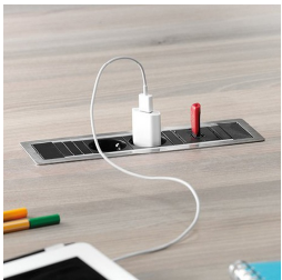
Optional je zwei Steckdosen mit USB Port oder Netzwerkanschluss: links und rechts