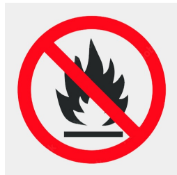
Trägerplattenmaterial schwer entflammbar nach DIN 4102 B1