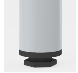
Bodenschoner mit Niveauegleich: gleicht Bodenunebenheiten aus