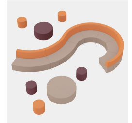
Mit den Serien CYLINDRA und BLOC kombinierbar