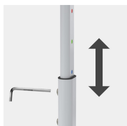
Mittels Arretierung in der Höhe verstellbar