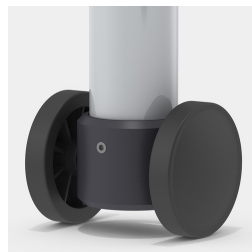
Optional Gestell fahrbar mittels 2 Bockrollen