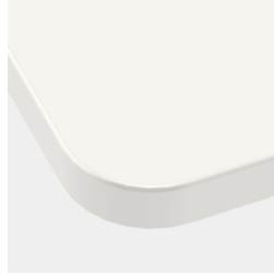
Optional Tischplatte mit 40 mm Eckradius