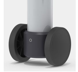
Optional Gestell fahrbar mittels 2 Bockrollen