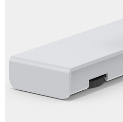
Bodenschoner mit Niveauegleich zum einfachen Ausgleichen von Bodennebenheiten