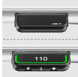
Handschalter mit Auf- und Ab- Funktion oder optional mit Memoryfunktion