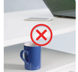
Kollisionsschutz minimiert das Risiko von Schäden beim Auf- und Abfahren