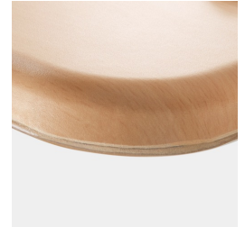
Optional WOODMARK Tischplatte in bruchfester Qualität