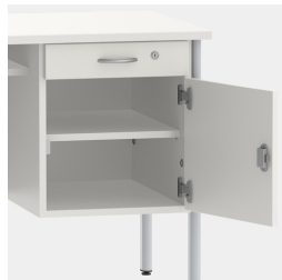
Unterschrank inkl. Schublade, mittels Sicherheitsschloss abschließbar