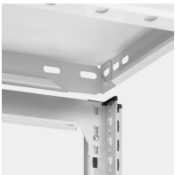
Stecksystem ohne Schrauben