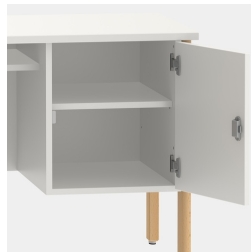
Unterschrank inkl. einem Fachboden, mittels Sicherheitsschloss abschließbar