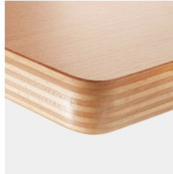
Optional Tischplatte Multiplex melaminharzbeschichtet