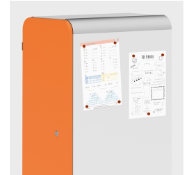
Optional mit magnethaftenden Seiten