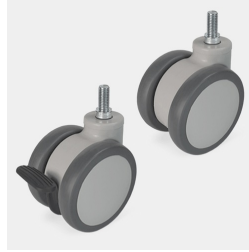
Fahrbar auf 4 Rollen davon 2 feststellbar