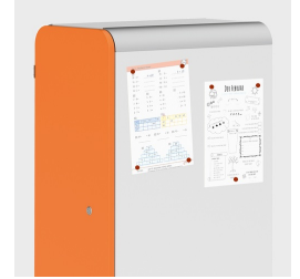
Optional mit magnethaftenden Seiten