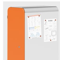
Optional mit magnethaftenden Seiten