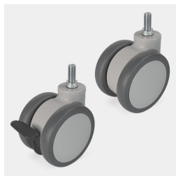
Fahrbar auf 4 Rollen davon 2 feststellbar