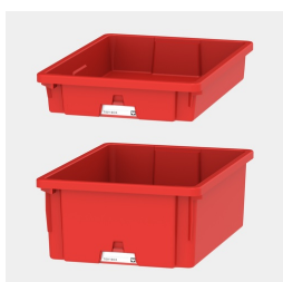
Tidy Boxen zur Aufbewahrung