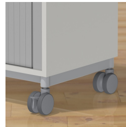
Rollladerschrank optional fahrbar mit Rollen