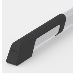
Bodenschoner mit integriertem Trittschutz