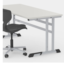
Durch C-Form kein Stören der Tischbeine beim Ein- und Aussteigen