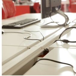
Platte auf Gleitbeschlag verschiebbar für verdeckte Kabelführung, abgedichtet mit Gummilippe