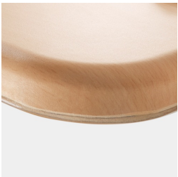
Optional WOODMARK Tischplatte in bruchfester Qualität