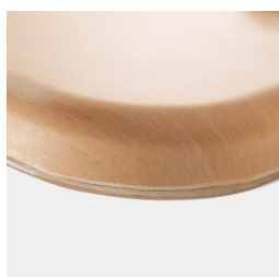
Optional WOODMARK Tischplatte in bruchfester Qualität