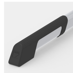
Bodenschoner mit integriertem Trittschutz