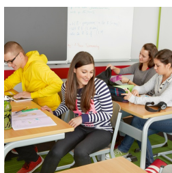
Durch C-Form kein Stören der Tischbeine beim Ein- und Aussteigen