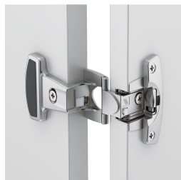
Metall-Topfscharnierbänder mit 240° Öffnungswinkel