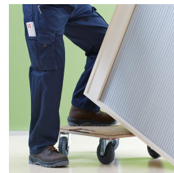
Korpus ab Werk fest verdübelt und verleimt für schnellen Aufbau vor Ort