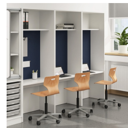
Seitenwände für besseren Blend- und Sichtschutz