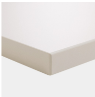
Plattenmaterial melaminharzbeschichtet mit robuster Kunststoffkante