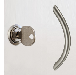
Standardmäßig mit Schloss und Griff, 1 OH mit Schloss oder Griff