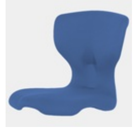
Optional Sitzschale Vollpolster ab Größe 5