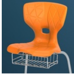
Optional mit Buchablagekorb ab Größe 5