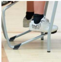
Robustes C-Form Gestell mit ASS FLOORSAFE® Bodenschoner