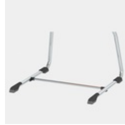
Optional mit Querstrebe ab Größe 5