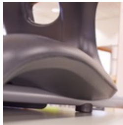
Plattenschoner schützen den Tisch beim Aufstuhlen