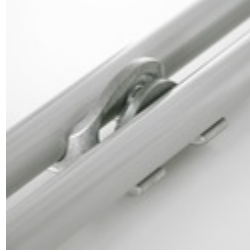
Optional mit Reihenverbindung ab Größe 5