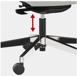
Stufenlose Gaslifthöhenverstellung inkl. Sitztiefenfederung