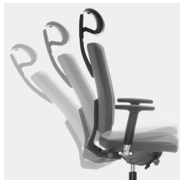
Selbstwiegende Synchronmechanik passt Federkraft bzw. Widerstand automatisch an