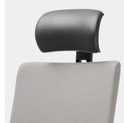
Kopfstütze mit Lederbezug: Höhe und Neigungswinkel verstellbar