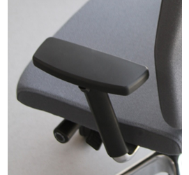
Armlehne dreidimensional verstellbar