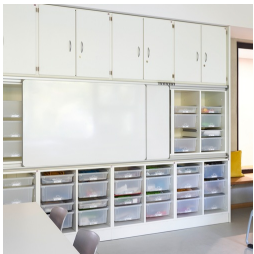
Montierbar an Schrankwand