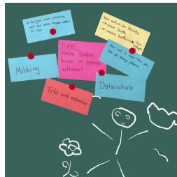
Magnethaftende Oberfläche mit Kreide beschreibbar