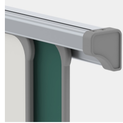
Kunststoffkappen verhindern unbeabsichtigtes Herausstoßen