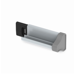
Unsichtbare Schienen-Befestigung gleicht Wandunebenheiten aus