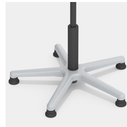
Absolut robustes Alu-Fußkreuz