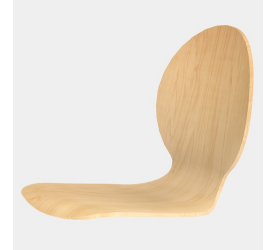
Körpergerecht geformte Sitzschale