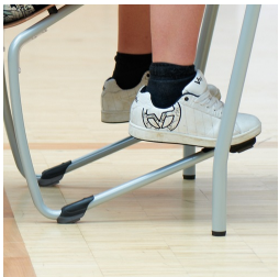
Robustes C-Form Gestell mit ASS FLOORSAFE® Bodenschoner