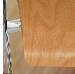
Sitzschale umweltfreundlich lackiert mit Lack auf Wasserbasis