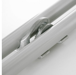
Optional mit Reihenverbindung ab Größe 5