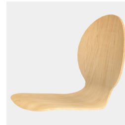
Körpergerecht geformte Sitzschale