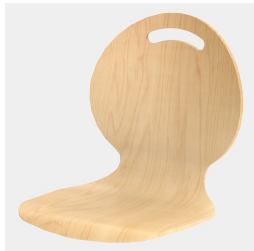
Optional mit Griffloch in Nierenform (nicht mit Rückenpolster)