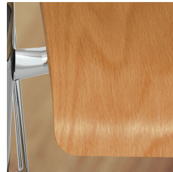
Sitzschale umweltfreundlich lackiert mit Lack auf Wasserbasis