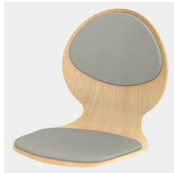
Optional mit Sitz- und Rückenpolster