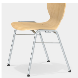
Robustes 4-Bein Gestell