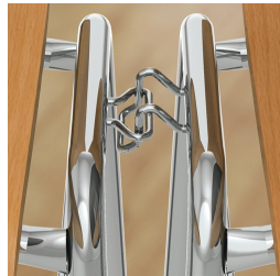
Gestell inklusive Reihenverbindung