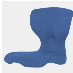
Optional Sitzschale Vollpolster ab Größe 5