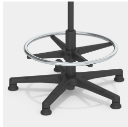
Erhöhung mit verchromtem Fußring, höhenverstellbar