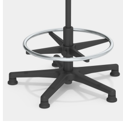
Erhöhung mit verchromtem Fußring, höhenverstellbar