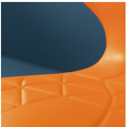
Sitzschale mit integrierten Lüftungskanälen