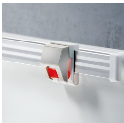
Optional mit Bilderklemmleiste